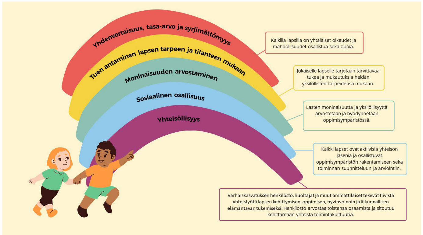
Kuvio 3. Inklusiiviset periaatteet Tampereen kaupungin varhaiskasvatuksessa ja esiopetuksessa.

Varhaiskasvatusta toteutetaan inklusion periaatteiden mukaisesti. Inklusiossa on kyse varhaiskasvatustoiminnan järjestämisen arvoperustasta ja ideologisesta, kokonaisvaltaisesta tavasta ajatella, mikä johtaa lapsen osallisuutta vahvistaviin pedagogisiin ratkaisuihin sekä monimuotoisiin ja joustaviin opetusjärjestelyihin. Inklusion käytännön toiminnan toteuttamisessa näkyviä arvopohjaisia periaatteita ovat kaikkia lapsia koskevat yhtäläiset oikeudet, lapsen edun ensisijaisuus, tasa-arvoisuus, yhdenvertaisuus, syrjimättömyys, moninaisuuden arvostaminen sekä sosiaalinen osallisuus ja yhteisöllisyys. Ihmiset ovat erilaisia, ja kaikenlaista erilaisuutta kunnioitetaan ja arvostetaan. Inklusio tulee nähdä jatkuvana pyrkimyksenä etsiä parempia tapoja vastata moninaisuuteen ja oppia siitä.