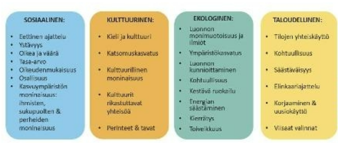
Kuvio 4: Kestävä elämäntapa varhaiskasvatuksessa ja esiopetuksessa.

Varhaiskasvatuksessa toteutettavan arjen kestävyystyön tueksi on laadittu Kestävä elämäntapa Tampereen varhaiskasvatuksessa ja esiopetuksessa -opas. Opas avaa kestävä tulevaisuuden työn tarkoitusta ja taustaa sekä tuo esille Tampereella käytössä olevia toimintatapoja ja yhteistyötahoja.