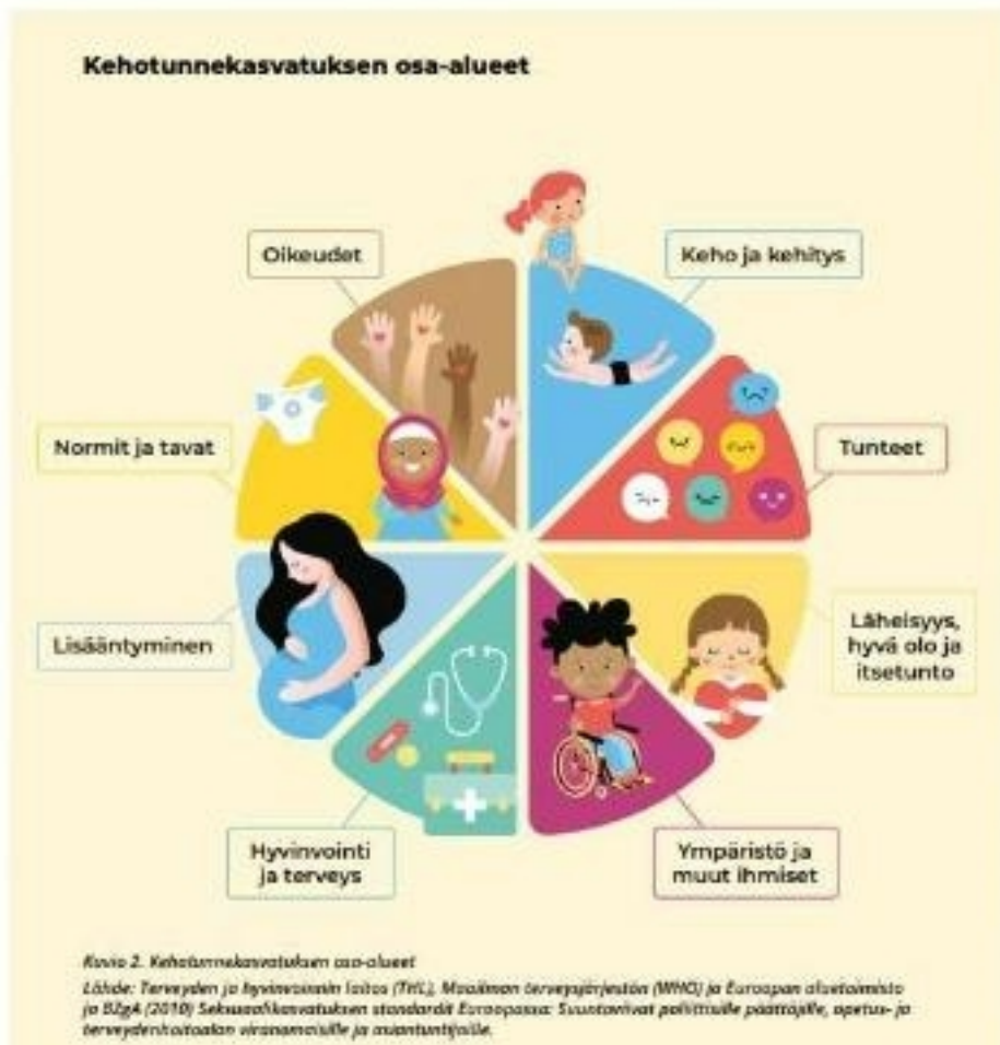
Kuvio 2. Kehotunnekasvatuksen osa-alueet.

Lapsia kannustetaan avoimeen ja sallivaan keskusteluun ja luodaan turvallinen ilmapiiri, jossa kaikille tunteille ja kysymyksille on tilaa. Aikuisella on vastuu siitä, että lapsi uskaltaa kääntyä kaikissa kysymyksissä ja ongelmissa aikuisen puoleen.