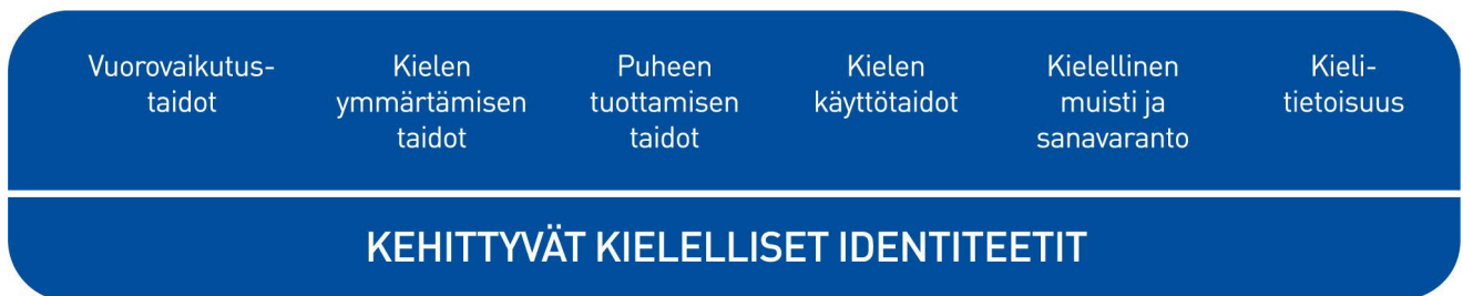
Kuvio 6. Lasten kielen kehityksen keskeiset osa-alueet varhaiskasvatuksessa

Varhaiskasvatuksessa kiinnitetään huomiota lukemisen ja tarjolla olevan kirjallisuuden ja lukumateriaalin määrään, laatuun ja saavutettavuuteen. Pedagogisessa toiminnassa panostetaan aitoon, kiireettömään vuorovaikutukseen ja rikkaaseen lukukokemukseen lasten kiinnostuksen kohteet ja ikäkaudet huomioiden. Varhaiskasvatuksessa tuetaan perheiden lukemisen käytänteiden rakentumista tuomalla esille varhaislukemisen hyötyjä lapsen kielelliselle kehitykselle ja lukutaidolle sekä tarjoamalla monipuolisia lukemisen malleja.