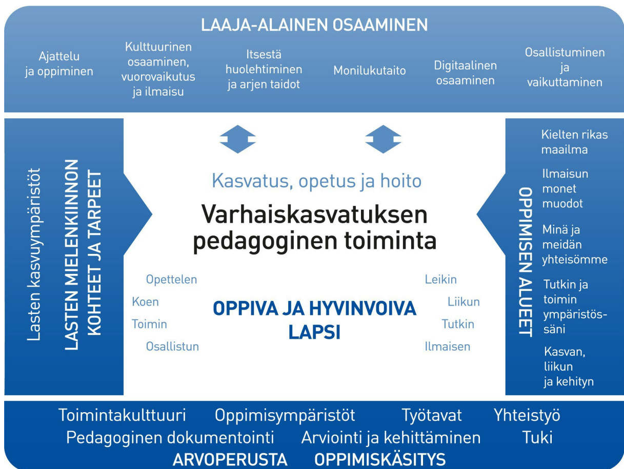
Kuvio 5. Varhaiskasvatuksen pedagogisen toiminnan viitekehys

Varhaiskasvatuksen pedagogista toimintaa ja sen toteuttamista kuvaa kokonaisvaltaisuus. Tavoitteena on edistää lasten oppimista ja hyvinvointia sekä laaja-alaista osaamista (kuvio 1). Pedagoginen toiminta toteutuu lasten ja henkilöstön välisessä vuorovaikutuksessa ja yhteisessä toiminnassa. Lasten omaehtoinen, henkilöstön ja lasten yhdessä ideoima sekä henkilöstön suunnittelema toiminta täydentävät toisiaan. Varhaiskasvatuksen pedagoginen toiminta läpäisee kasvatuksen, opetuksen ja hoidon kokonaisuuden.